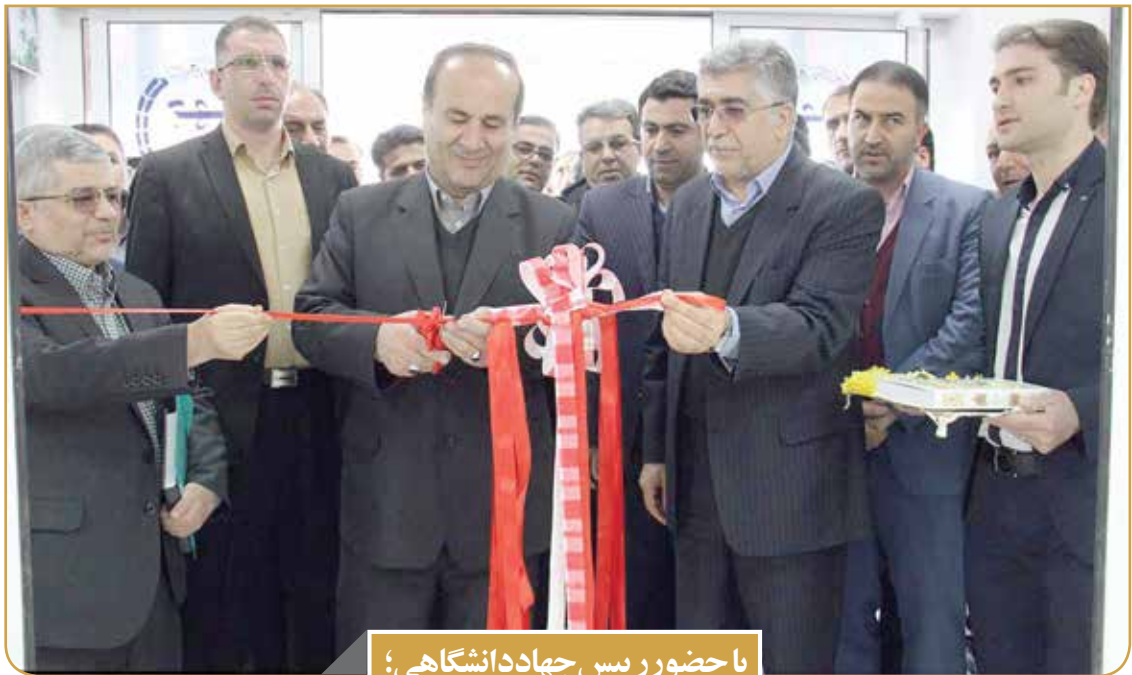
با حضور رییس جهاد دانشگاهی؛