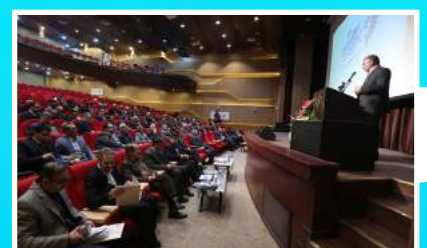
▲ گردهمایی روسای جهاد دانشگاهی - تهران ۱۵ و ۱۶ دی ماه ۹۵