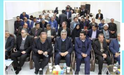
▲ افتتاح مجتمع آموزشی تحقیقاتی جهاد دانشگاهی واحد چهارمحال و بختیاری ۱۱ دی ماه ۹۵