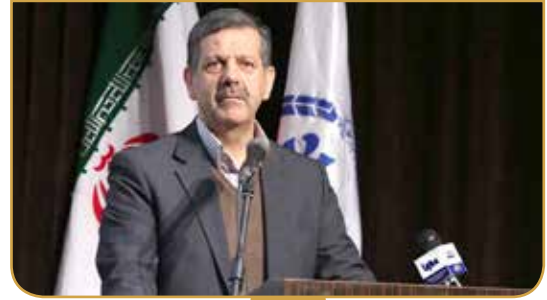
مشاور رییس جهاد دانشگاهی خیر داد: