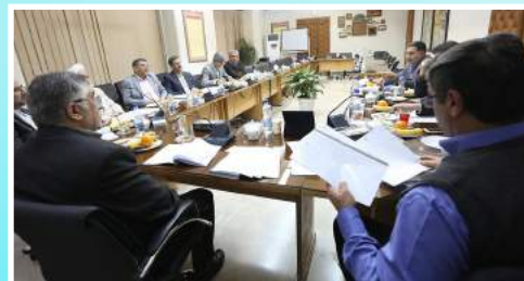
▲ جلسه هیأت امنای جهاد ۹ دی ماه ۹۵